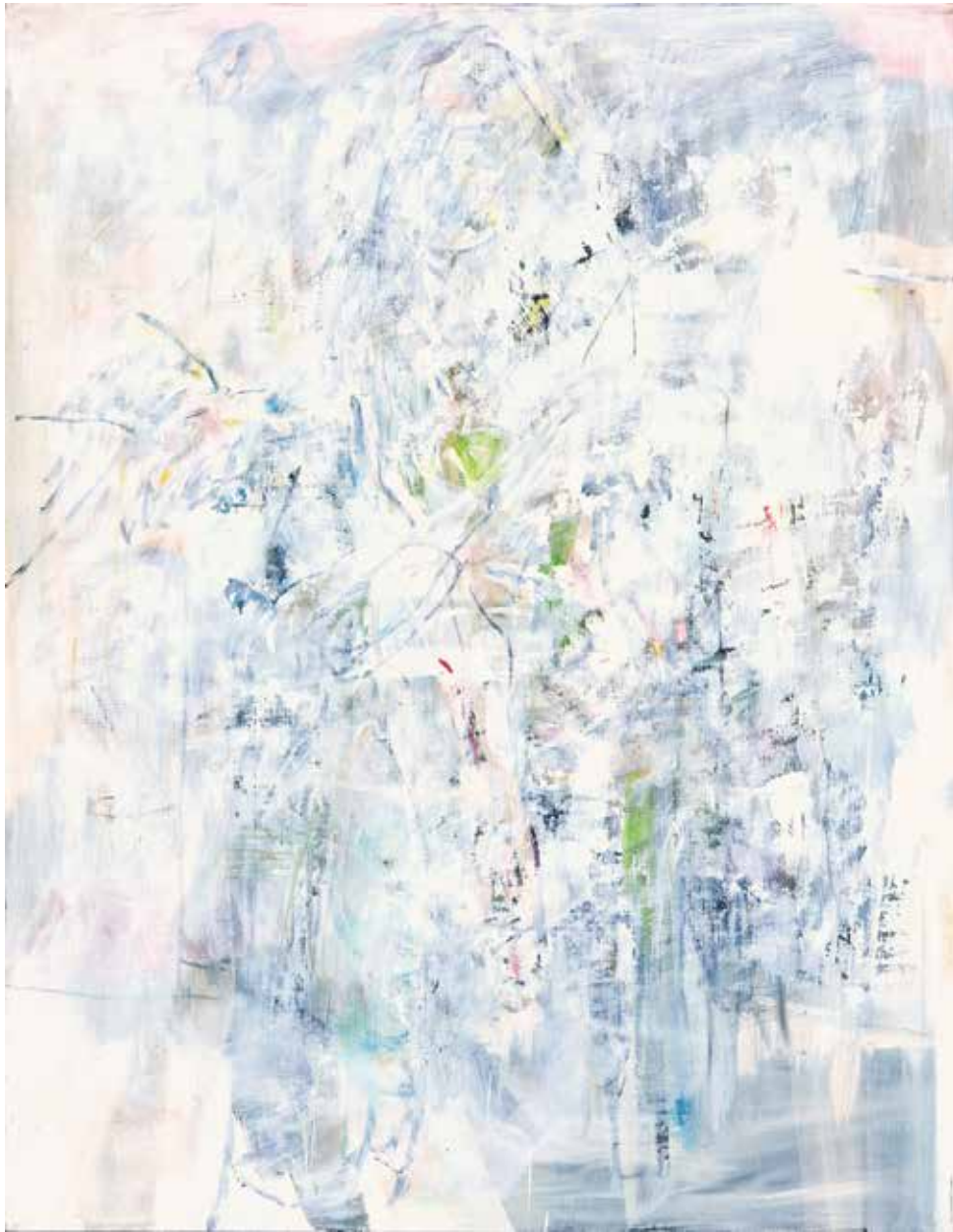
Portretna figura II, 1996.–2014., ulje na platnu, 115 × 90 cm