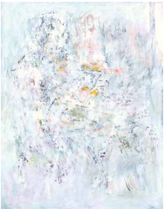
Portretna figura III , 1996.–2014., ulje na platnu, 115 × 90 cm